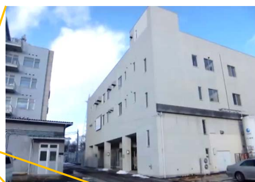
マイクロ・ナノマシニング 研究教育センター（MNC）