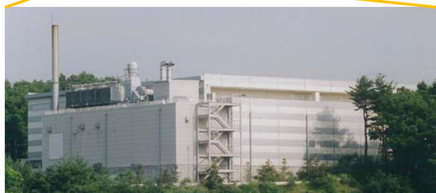
西澤潤一記念研究センター