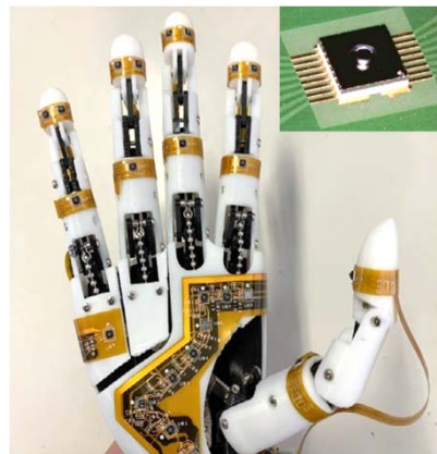
図2 ロボットハンド*に実装した集積化触覚センサ *東京都立産業技術高等専門学校 深谷直樹准教授提供